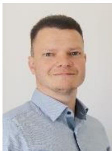
ZT Philipp von Cieminski Fa. ic med GmbH